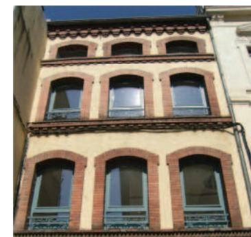
La résidence Chauffour, CALD, Valence

Vous y trouverez également l'ensemble des documents qui ont été présentés lors du colloque et un compte-rendu des échanges.