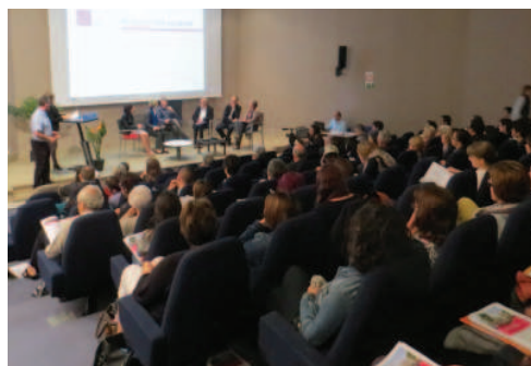
Pendant la rencontre annuelle de la Mission d'Observation, le 9 octobre 2014

Ne relevant ni de l'hébergement, ni du logement autonome de droit commun, le logement accompagné est un « tiers-secteur » en plein développement. L'UNAFO, l'union professionnelle du logement accompagné, explique que ce terme recouvre « toutes les solutions de logement très social proposant une gestion de proximité, un accompagnement et des prestations variées ». Le public visé est principalement celui de la loi visant la mise en œuvre du droit au logement du 31 mai 1990 (dite « loi Besson »), c'est-à-dire des ménages ayant des difficultés d'accès et/ou de maintien dans le logement pour des raisons économiques et/ou sociales.