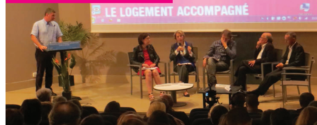
Rencontre annuelle de la Mission d'Observation, le 09 octobre 2014