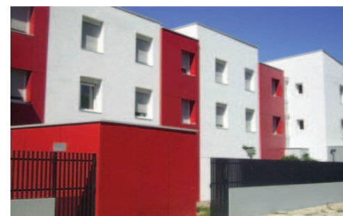
Pension de famille l'Envol, CALD, Pierrelatte