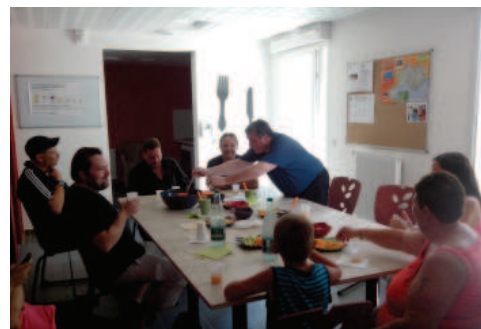
Une ambiance conviviale : repas à l'Envol, pension de famille du CALD, Pierrelatte

exemple l'Accompagnement Vers et Dans le Logement, ou l'Accompagnement Social Lié au Logement pour des ménages en logement ordinaire. Ils ne rentrent pas dans la définition de l'UNAFO car ils ne constituent pas une offre de logement.