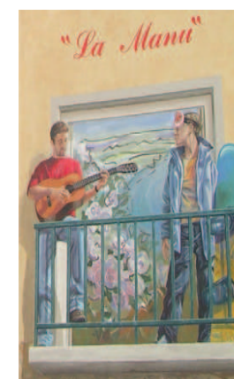
Détail de la façade du FJT de la Manu, Valence

En Ardèche, on compte environ 400 logements accompagnés. Cela représente à peu près une offre de 2,6 logements accompagnés pour 1000 ménages. Dans la Drôme, le parc de logements accompagnés est plus étoffé : on recense près de 1 750 logements de ce type, ce qui représente 8 logements pour 1000 ménages. Le parc de logement accompagné reste majoritairement concentré dans les grands pôles mais la couverture territoriale s'améliore. Les solutions de logement accompagné en logements individuels permettent de développer cette offre dans de plus petites communes.